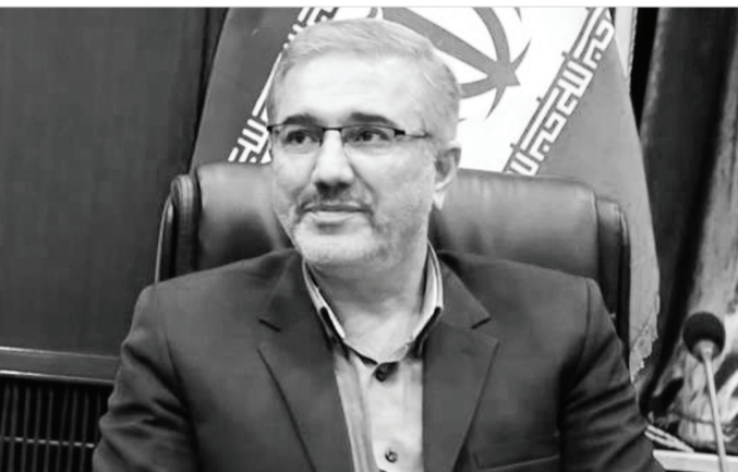
رئیس سازمان برنامه و بودجه اعلام کرد: